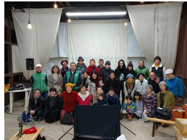
新たな事業: 芸術生誕祭開催することができた