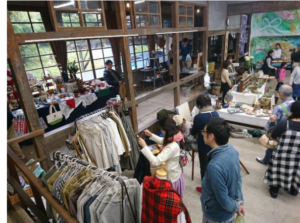
伊丹陣屋のにぎわい