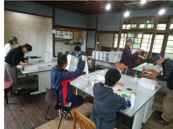
県立幕張総合高等学校 放送委員会生徒さんも行燈づくり