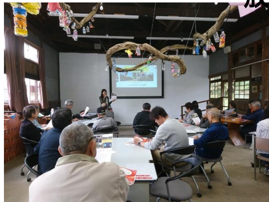
浦安市市民大学視察受入れ