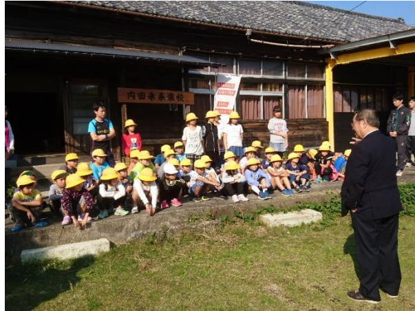
内田小学校との連携