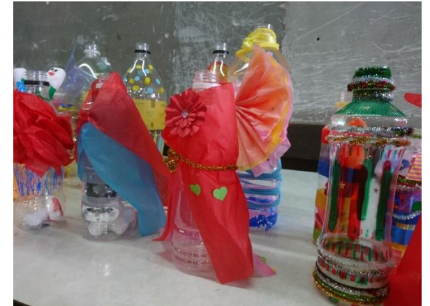
(社法)第2クローバー学園 との連携