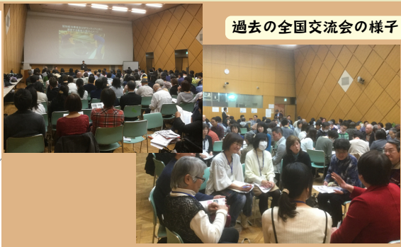
過去の全国交流会の様子