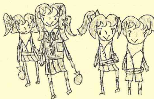
イラスト：山本江美子