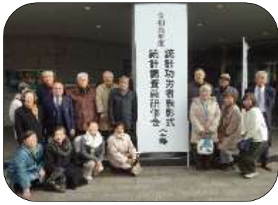
令和元年度統計功労者表彰及び統計調査員研修会に参加された方々