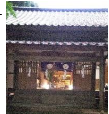
はちまん 八幡神社