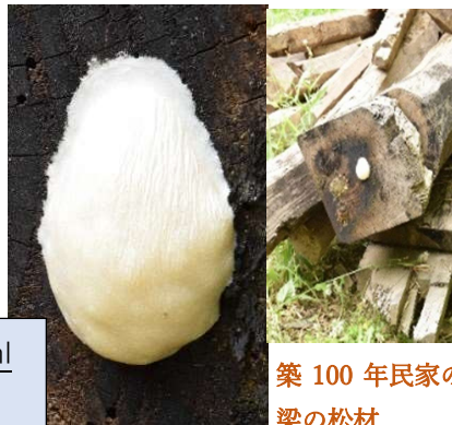
築100年民家の梁の松材