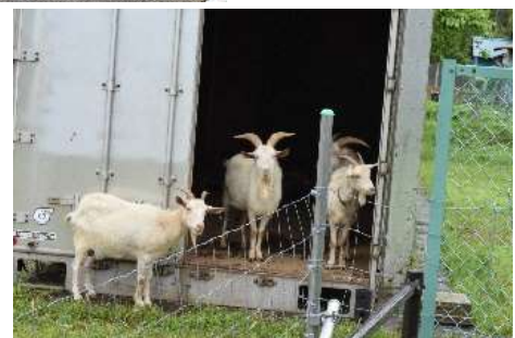
5/22AM6:52 ↑上がりを待つ 文責 中村(良)