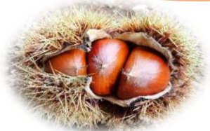
秋の味覚 9/5 能満地区