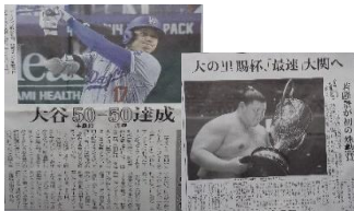
大谷 メジャー史上初の偉業 9/19 大の里優勝「最速」大関へ 9/22

観測史上最高の能登地方の大雨、そして琵琶湖北部の深層では「無酸素状態」が確認され、湖底生物への影響が懸念されているという報道がありました。自然環境の危機が募ります。