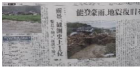
能登地震復旧を直撃 豪雨、9/21〜9/23