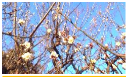
白梅 1/26 能満地区