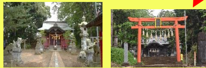
市原の「鎮守の森」では粘菌が多々発見されています。

能登半島大規模地震に襲われ、困難が続いています。スポーツに情熱を傾ける若者たちの力強い姿には、故郷を想う熱い心が溢れています。明るい未来があります。