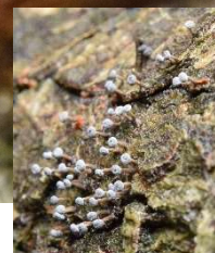
シロジクモジホコリ