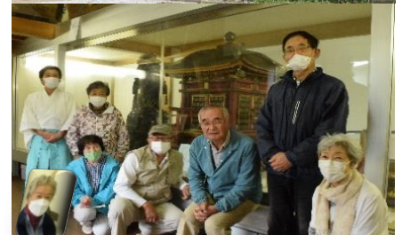
10/17 秋の観察会 飯香岡八幡宮 宝物殿内・足利義満公の寄進による神輿・みこしの前にて。貴重な拝観となりました。7名