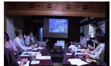
10/15 庭園文化講座 出前講座 12名