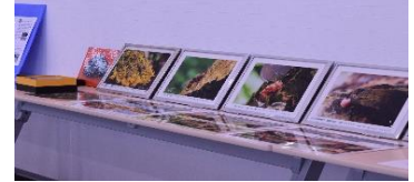
10/1 ウェルコミオープン 粘菌紹介コーナー

青空に遥か遠く冠雪の富士山が市原の高台から見えました(10/24)。寒さがやって来たようです。夏の頃、あちこちに現れた粘菌たちも、冬ごもりでしょうか。すっかり生りを潜め、静かな古木がじっとその時を待っているようです。コロナ感染の不安もようやく治まり、日常生活が戻りつつあります。会の後半は私達も野外から室内の粘菌学校等の集まりになります。皆さん、健康管理に注意し、これからの季節を乗り越えていきましょう。