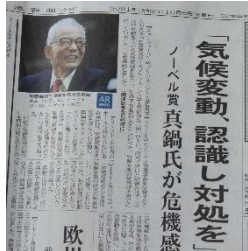
10/5 ノーベル物理学賞 真鍋淑郎氏と発表