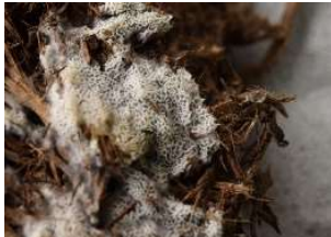
ブルーベリー畑で発見 ヘビヌカホコリ