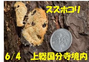
ススホコリ 6/4 上総国分寺境内

梅雨入り真ただ中、コロナ危機全面解除になり、ようやく日常の暮らしが進み出しました。粘菌達との出会い、グループを応援してくれる方々との交流、仲間達との久方の憩いのひとときは、今を生きる喜びそのものです。コロナウイルスには、しばらく注意を払いながら、粘り強く、たくましく、粘菌の知恵を真似て生きていきましょう。