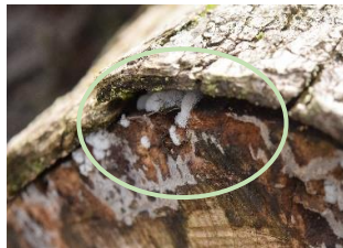
エダナシツノホコリ (6/13)