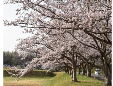
桜並木 3/31 (市原市能満地区)

ひっそりと身を潜めていた粘菌も、いよいよ私達との対面の季節となります。神秘的その生き物は、たくましく、愛らしく、時には「森の宝石」とも呼ばれています。今年度も自然の中で、仲間と共に感動体験をしましょう。