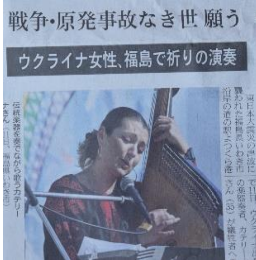
3/11 平和への祈り。 福島県いわき市にて