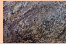
郡本八幡神社境内