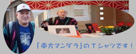
「南方マンダラ」のTシャツです!