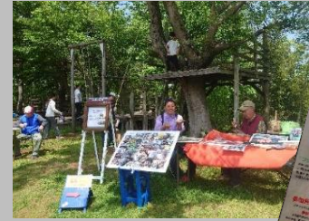
粘菌コーナー 地域交流・フットパス参加