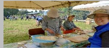
「遊育の森」は新緑でいっぱい! 担当(餅・たけのこ汁・展示) 会員5名も頑張った!