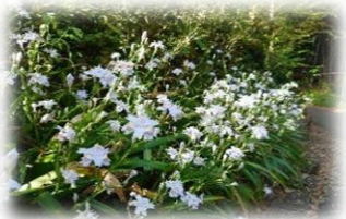
シャガの花 4/13 鹿の被害で全滅と聞きました。 能満地区は無事です。