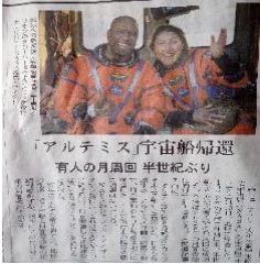
宇宙船「オリオン」 4人の飛行士、無事帰還 4/1~4/10

半世紀ぶりの宇宙船が、人類最遠地点に到達し、無事帰還しました。宇宙からの眺めに飛行士が「地球に住めていることを、とても幸運に思うべきだ」と語っています。