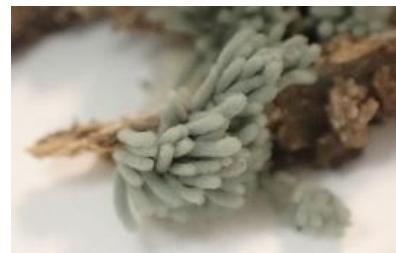
片岡祥三氏寄贈 (公財)南方熊楠記念館蔵

ウツボホコリ四天王の内、 3 種が市原市内で発見され ています。(会報 45 号紹介) 残る 1 種のアオウツボホコ リは、この市原で発見でき るでしょうか??