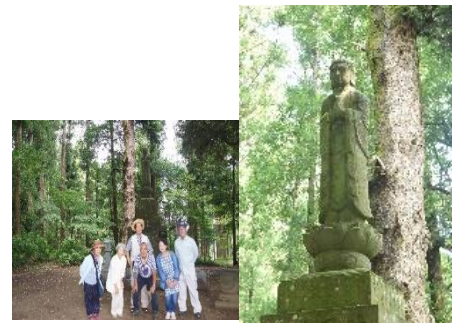
8/7 粘菌観察会 奈良の大仏 市原市奈良字大仏台 6名

朝に夕に、セミの大合唱が聴かれるようになりました。猛暑、大雨による災害、ウイルス感染の再びの増加、まだまだ続く悲惨な国の人々の姿……。それぞれに、きつい夏となりました。そんな中、若者の活躍の姿は、多くの人々に希望や夢を与えてくれました。粘菌観察の道中でも、いろいろな予期せずの出来事があります。自然そして人々との出会いが、その後、共に生きる喜びとなれば、それは嬉しいことでしょう。