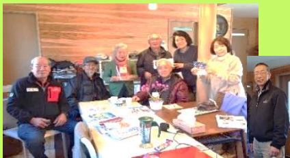
和歌山に届けたい! 記念写真